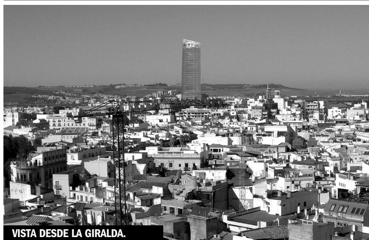
VISTA DESDE LA GIRALDA.