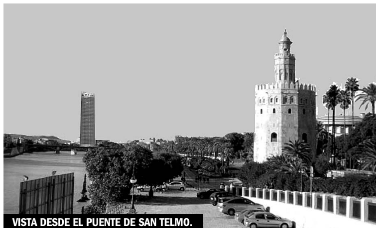
VISTA DESDE EL PUENTE DE SAN TELMO.

Fotomontajes elaborados por la plataforma ¡Tumbala!