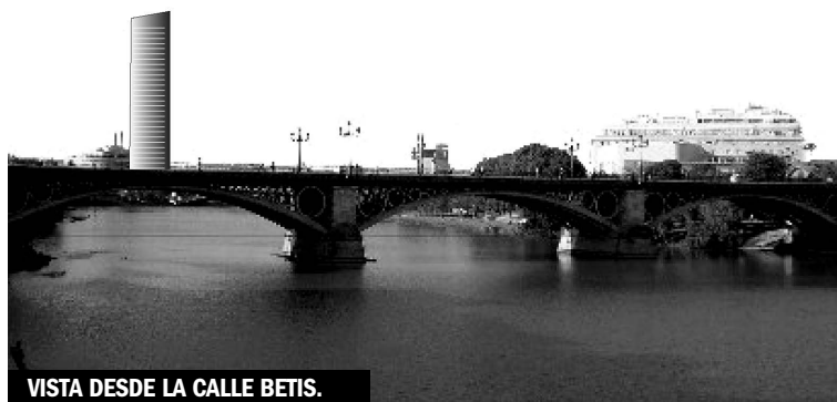
VISTA DESDE LA CALLE BETIS.