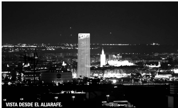
VISTA DESDE EL ALJARAFE.